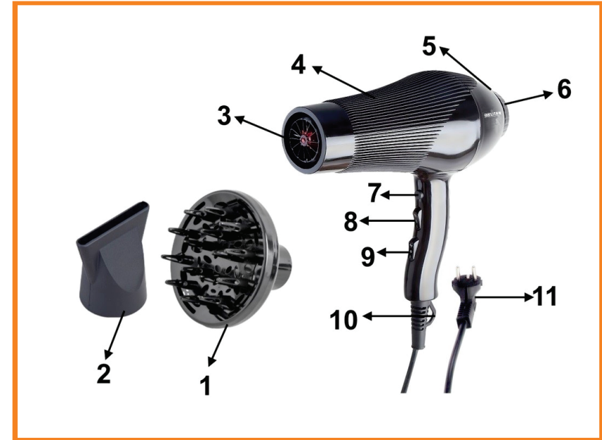
معرفی قطعات :